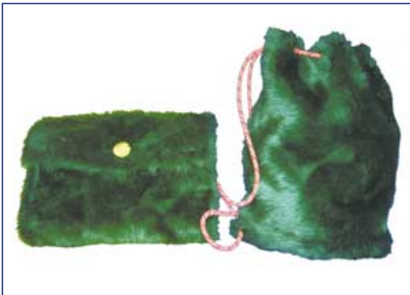
unten: Friedrich Rippmann: Muff-Tasche und Matchesack, Kunstfell, Futter: rote Seide, wattiert und gesteppt, Innentaschen (1994)