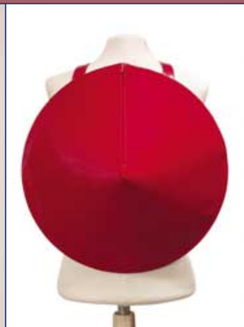
Friedrich Rippmann: Kegeltasche „Reisbauer-Hut“, rotes Lackleder, drei Reißverschlüsse, Futter rote Seide mit chinesischen Ornamenten, Innentasche mit Reißverschluss (1999)