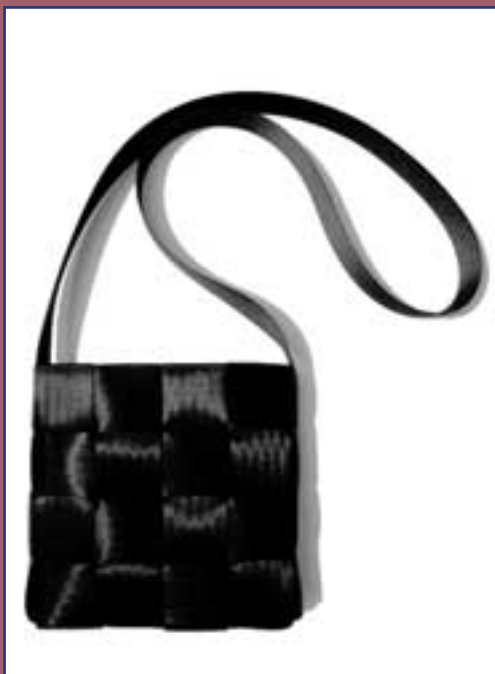
Friedrich Rippmann: Quadrattasche „4 x 4 x 1“, Material Sicherheitsgurt (2002)

grammtaschen in kontrastfarbenem Leder oder Varianten des klassischen Matchesacks in transparenter Baufolie.