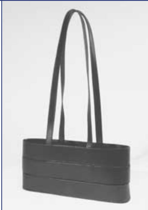
Friedrich Rippmann: Höhenverstellbare Tasche (2000)