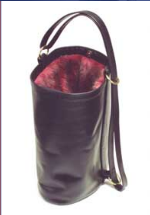
Friedrich Rippmann: „Eimertasche“, Ringe Messing massiv, Futter lila Kunstfell (1994)

Das gestalterische Ziel ist dann erreicht, wenn die geometrischen und materiellen Vorbedingungen sich mit den Funktionen in Einklang bringen lassen. Wenn eine Tasche derart „funktioniert“, wird sie zu einem vertrauten, zuverlässigen Freund ihrer Trägerin/ihrer Trägers. Der Anspruch der Dauerhaftigkeit, den Rippmann formuliert, stellt in einer Zeit des zielgruppenorientierten Produktmarketing einen wohltuenden Anachronismus dar, möglicherweise liegt hier auch seine Entschei-